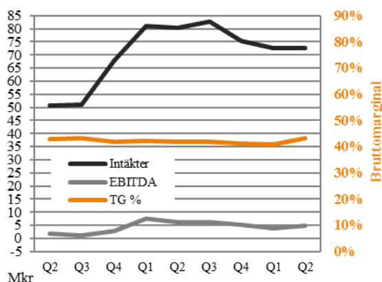
Rullande 12-månader Q2 2014 – Q2 2016